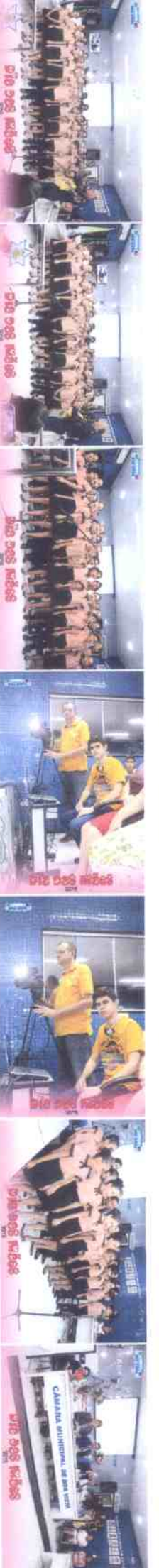
IMG_0775 (Copy).JPG IMG_0776 (Copy).JPG IMG_0777 (Copy).JPG IMG_0778 (Copy).JPG IMG_0779 (Copy).JPG IMG_0780 (Copy).JPG IMG_0781 (Copy).JPG