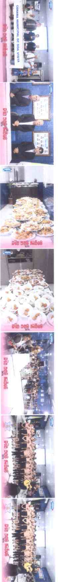
IMG_0768 (Copy).JPG IMG_0769 (Copy).JPG IMG_0770 (Copy).JPG IMG_0771 (Copy).JPG IMG_0772 (Copy).JPG IMG_0773 (Copy).JPG IMG_0774 (Copy).JPG