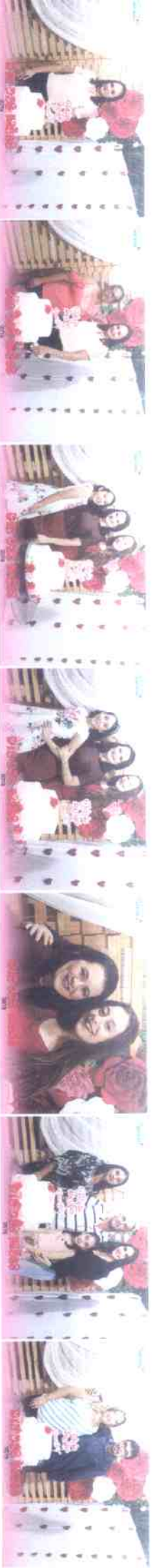
IMG_0754 (Copy).JPG IMG_0755 (Copy).JPG IMG_0756 (Copy).JPG IMG_0757 (Copy).JPG IMG_0758 (Copy).JPG IMG_0759 (Copy).JPG IMG_0760 (Copy).JPG