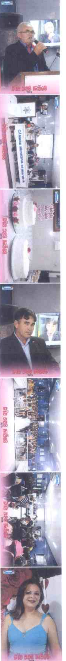
IMG_0782 (Copy).JPG IMG_0783 (Copy).JPG IMG_0784 (Copy).JPG IMG_0785 (Copy).JPG IMG_0786 (Copy).JPG IMG_0787 (Copy).JPG IMG_0788 (Copy).JPG