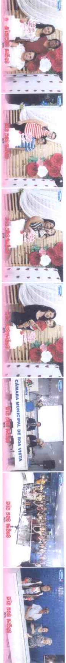
IMG_0761 (Copy).JPG IMG_0762 (Copy).JPG IMG_0763 (Copy).JPG IMG_0764 (Copy).JPG IMG_0765 (Copy).JPG IMG_0766 (Copy).JPG IMG_0767 (Copy).JPG